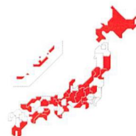
SFTSウイルスを保有した マダニの生息地域(2016年3月時点)

マダニは野外に生息する大型のダニで、 屋内に生息するダニ(コナダニ類・チリダニ類など)は この疾患とは関係ありません。