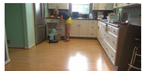
飼い主様にこんにちは～