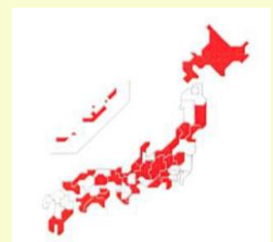
SFTSウイルスを保有したマダニの生息地域（2016年3月時点）

フィラリア、ノミ・マダニの予防期間に関しては、地域によって違ってきます。詳しくは獣医さんに確認してみてください。