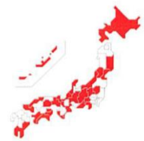
SFTSウイルスを保有した マダニの生息地域（2016年3月時点）