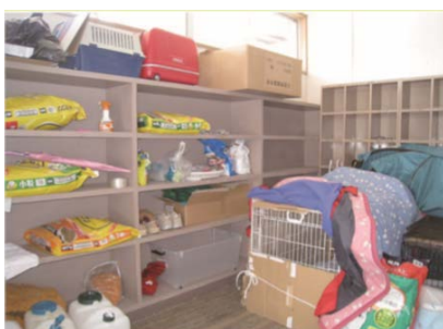
屋内で飼育している様子

ペットは、ストレスから体調を崩したり、病気が発生しやすくなるため、飼い主はペットの体調にも気を配り、不安を取り除くように努めなければなりません。実際に東日本大震災のペットの様子をご覧ください。