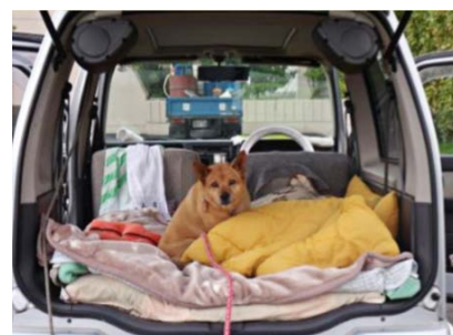
ペットとの車中泊